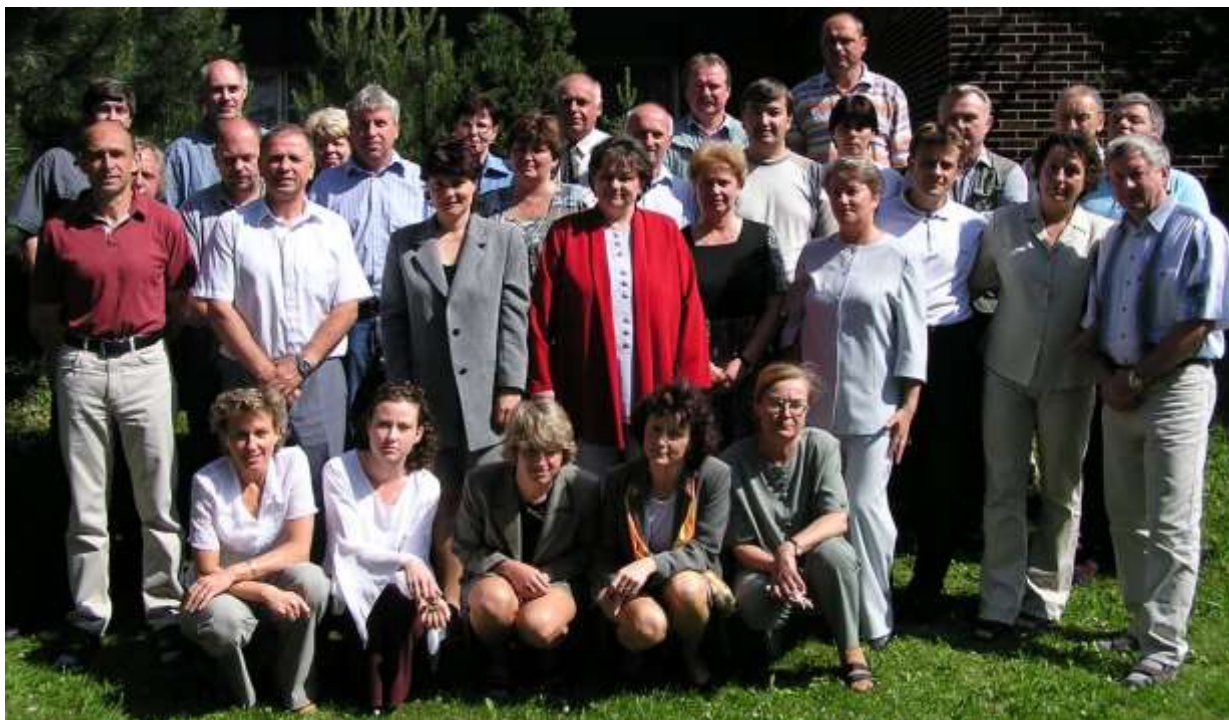
Poznáváte některé své kantory ? ☺