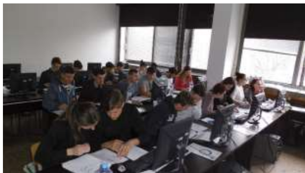
Rozpočtujeme s Calidou

SOŠ a SOU strojírenské a stavební Jeseník poskytuje studentům možnost srovnat znalostní „síly“ i s vrstevníky ostatních škol. Úspěchy zaznamenáváme v soutěžích v počítačovém modelování v programech AutoCad a Inventor do firmy Autodesk. Studenti druhých až čtvrtých ročníků oboru Strojírnoství se už několik let zúčastňují mezinárodní soutěže ve 3D modelování vyhlášené firmou Computer Agency s názvem Autodesk Academia. Dlouhodobě škola využívá nabídky k účastem na soutěžích v Počítačovém modelování, a to v konkurenčním programu CADKEY, kterou organizuje 3E Praha Engineering a.s., kdy SOŠ a SOU strojírenské a stavební Jeseník soutěží s vlastním softwarem.