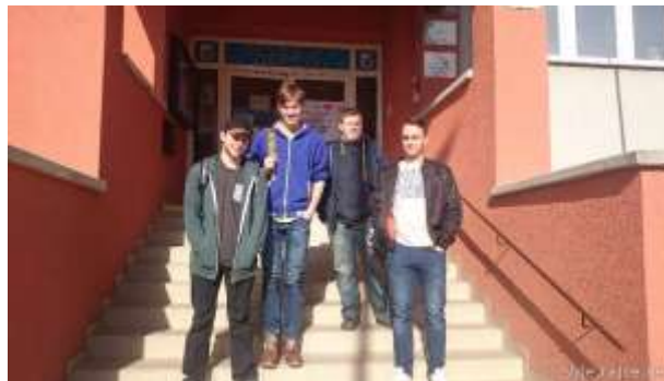
Regionální soutěž v CAD programech

Studenti čtvrtých ročníků oboru Stavitelství se každoročně účastní soutěže v Českých Budějovicích pod názvem Projektujeme v ARCHICadu a také ekonomické soutěže v Praze Rozpočtujeme s Callidou. Vybraní zástupci studijních i učebních oborů 3. ročníků reprezentují školu v celostátních soutěžích finanční gramotnosti, při kterých využívají získaných znalostí z předmětů ekonomika a občanská nauka. Studenti 2. a 3. ročníků oboru Instalátér se pravidelně zúčastňují soutěží, v nichž využívají jak nabitých vědomostí, tak i dovedností, organizovaných Cechem topenářů a instalatérů. V rámci kraje se umísťují na předních místech.