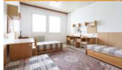
za domov mládeže